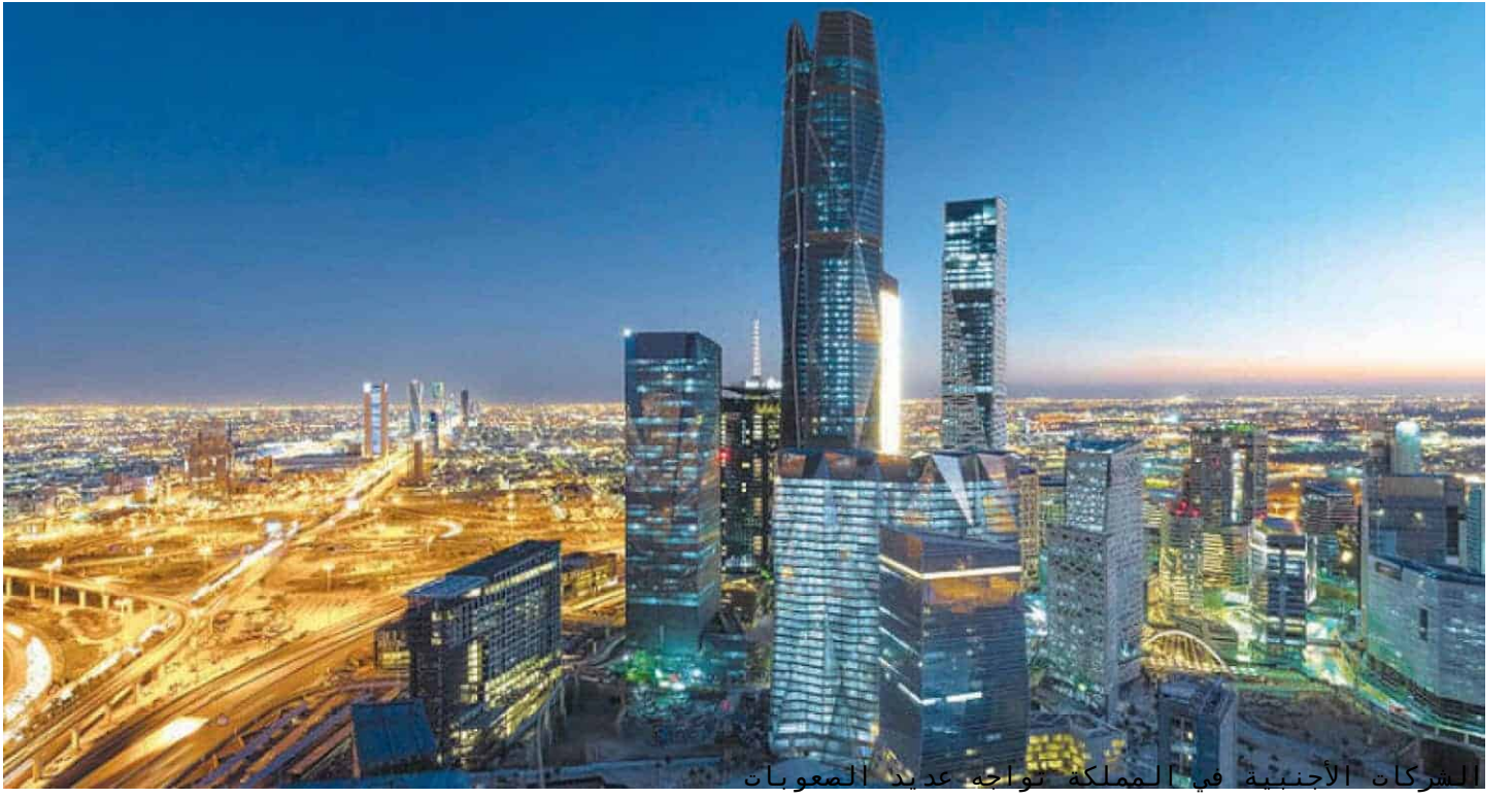
الشركات الأجنبية في المملكة تواجه عديد الصعوبات

وتدرك السعودية منذ فترة طويلة أن احتياجاتها التمويلية ستكون مدعومة في الغالب برأس المال المحلي وجزئيا فقط بأموال أجنبية. ومع ذلك، فإنها تريد أن تصل إلى 100 مليار دولار من الاستثمار الأجنبي المباشر سنويا بحلول عام 2030، وهو مبلغ أكبر بثلاث مرات تقريبا مما حققته في أي وقت مضى.