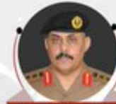
مدير المرور في القطيف العقيد بندر المطيري