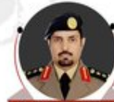
مدير الدفاع المدني في القطيف العقيد عيد سالم القحطاني