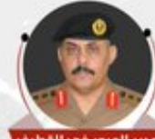
مدير المرور في القطيف العقيد بندر المطيري