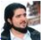
عبد العزيز بن فهد